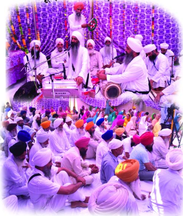
लाछड़ू ( पटियाला )