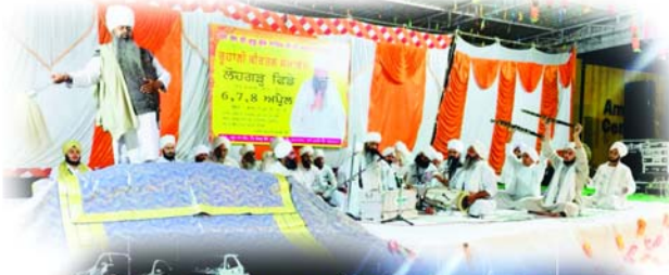
गाँव लोहगढ़ फिडे ( रूप नगर )