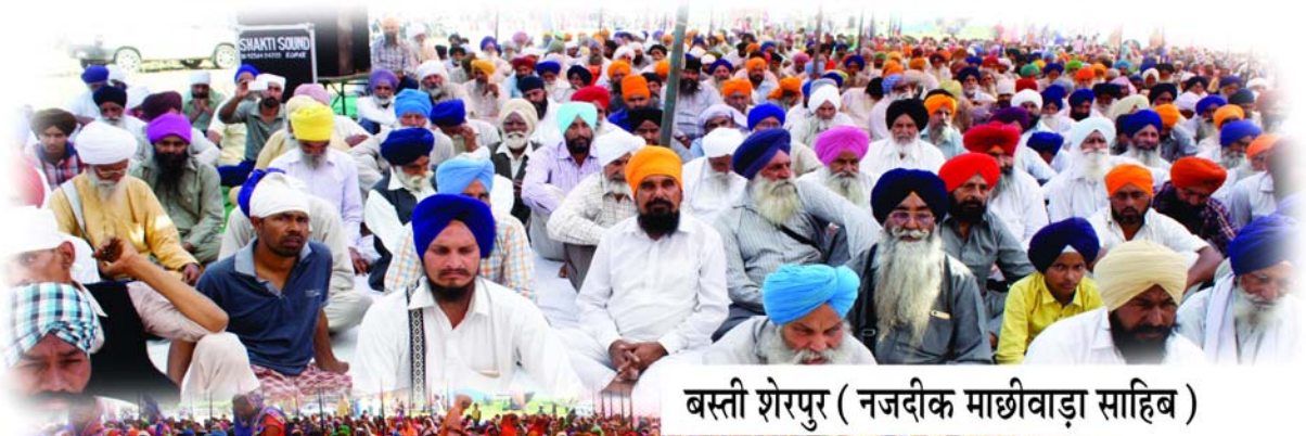
बस्ती शेरपुर ( नजदीक माछीवाड़ा साहिब )